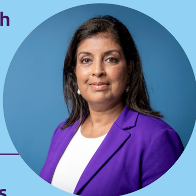
Staatssecretaris van Funderend Onderwijs en Emancipatie, Mariëlle Paul.